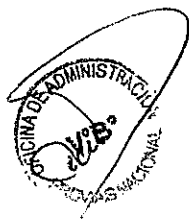
RICARDO BERNALES UZÁTEGUI DIRECTOR EJECUTIVO PROVIAS NACIONAL