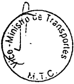
VERÓNICA ZAVALA LOMBARDI Ministra de Transportes y Comunicaciones